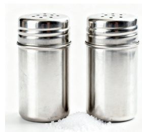
鹽 / 胡椒粉