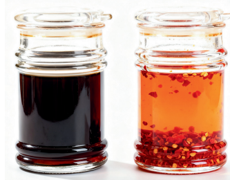
豉油 / 辣油