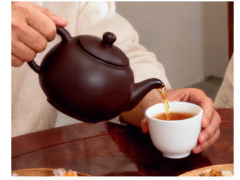
加水 / 茶